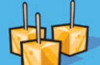
Fromage 50 g (1 ½ oz)