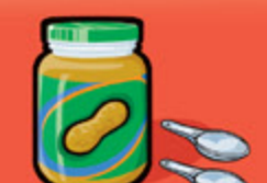
Beurre d'arachide ou de noix 30 mL (2 c. à table)