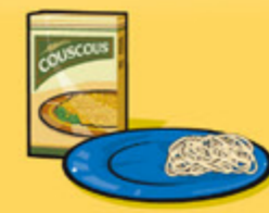
Pâtes alimentaires ou couscous, cuits 125 mL (½ tasse)