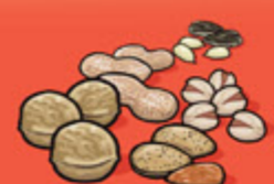
Noix et graines écalées 60 mL (¼ tasse)

Le tableau ci-dessus indique le nombre de portions du Guide alimentaire dont vous avez besoin chaque jour dans chacun des quatre groupes alimentaires.