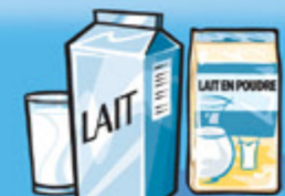
Lait ou lait en poudre (reconstitué) 250 mL (1 tasse)